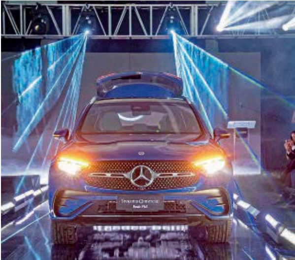
Varios modelos de Mercedes-Benz fueron exhibidos en el Centro de Convenciones Simón Bolívar de Guayaquil.