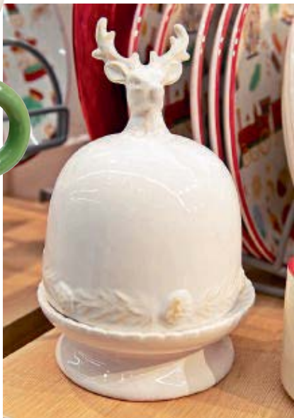
Bombonera Reno blanco: una elegante pieza de cerámica con acabado brillante, coronada por una majestuosa figura de reno esculpido.