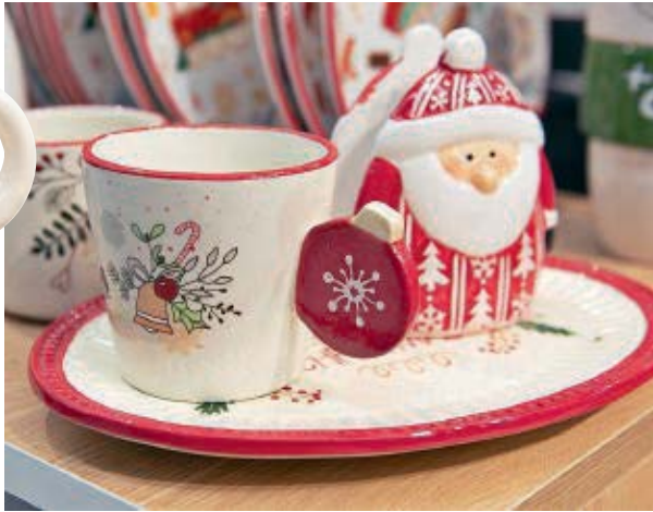
Set de merienda Santa y esfera: conjunto de taza y plato.