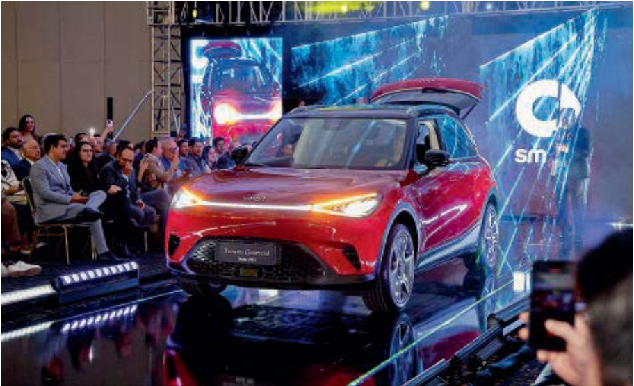
Smart, firma de origen alemán, incorporó al mercado ecuatoriano dos vehículos 100 % eléctricos como parte de su ingreso a la oferta de Teojama Comercial.