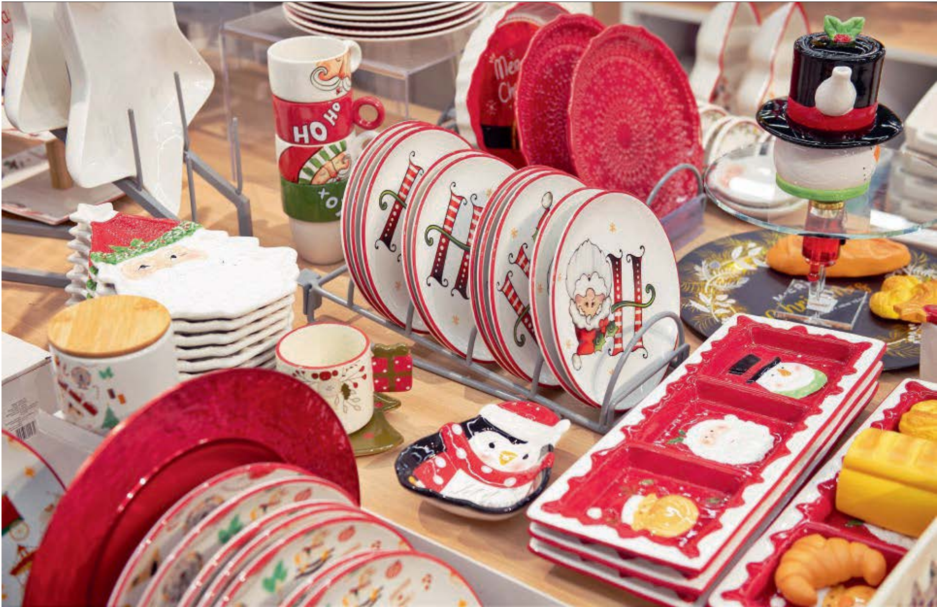
En Ecuador, vestir la mesa es un ritual de hospitalidad y cariño. Esta colección rinde homenaje a esa costumbre de sacar la vajilla especial navideña para honrar a nuestros invitados.

Este 2025 llena los rincones de tu casa con los tonos clásicos navideños: rojos intensos, verdes vibrantes, cafés cálidos y blancos puros. Cada pieza de Almacenes Estuardo Sánchez está pensada para inspirar, decorar y transmitir esa sensación de hogar y magia que todos anhelamos en Navidad. Desde texturas suaves que evocan noches acogedoras al momento de servirse los alimentos hasta brillos sutiles que iluminarán tu estancia con un aire verdaderamente festivo, las opciones para decorar cada espacio son tan diversas como emocionantes. Estas creaciones -que están en todas sus tiendas de Guayaquil, Quito, Manta y Machala- se entrelazan para crear ambientes que abrazan la alegría de las festividades decembrinas y celebran esos instantes que hacen del hogar el lugar más especial del mundo. Cada acabado no solo decora: cuenta una historia, enciende recuerdos e invita a vivir la temporada con magia. ¡Ve y descubre cómo transformar cada rincón en un lugar lleno de encanto y significado!