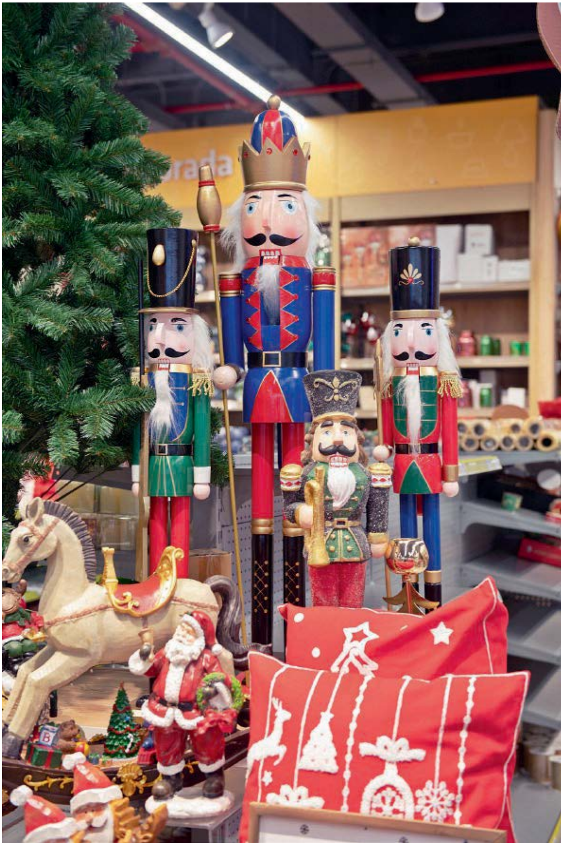
Imponentes y llenos de festivos colores, estos cascanueces son los guardianes perfectos de la Navidad.