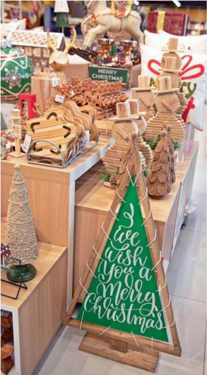
Un detalle rústico y moderno para recibir a tus invitados. Este letrero en forma de árbol con marco de madera es perfecto para colocar en la entrada de la casa o sobre una repisa.