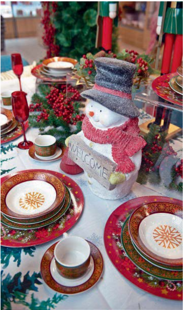
Esta clásica vajilla decorativa se complementa a la perfección con la alegría del invierno que evoca el tierno muñeco de nieve con un letrero navideño. Juntas se convierten en las piezas perfectas para servir aperitivos, galletas o dejarle un bocadito a Santa, llenando tu mesa de alegría y diversión.