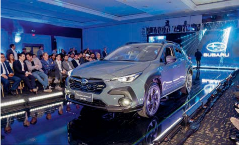
Además del Crosstrek (foto), Subaru dio a conocer que la marca japonesa contará con dos modelos más en las concesionarias de Guayaquil.