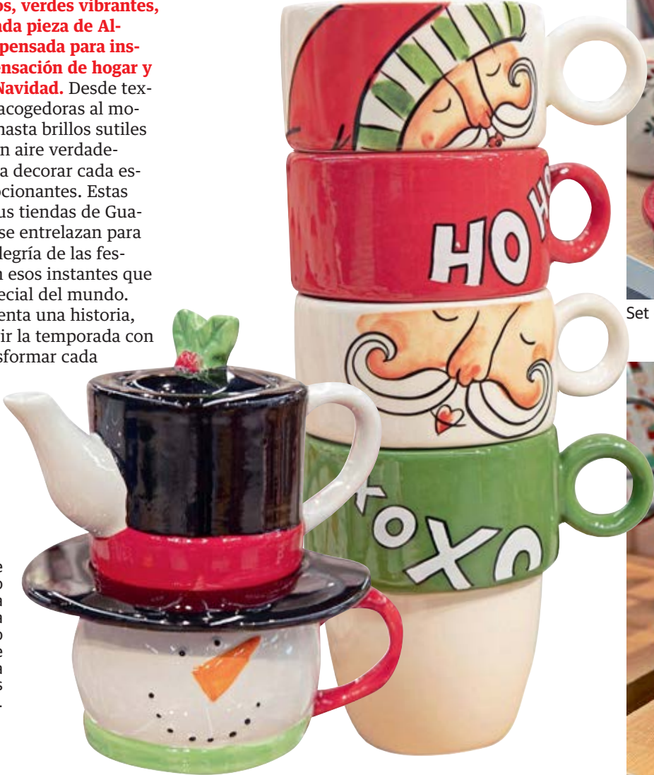
Esta tetera de sombrero negro reposa sobre una taza de un muñeco de nieve. Se complementa con jarros festivos.

Este 2025 llena los rincones de tu casa con los tonos clásicos navideños: rojos intensos, verdes vibrantes, cafés cálidos y blancos puros. Cada pieza de Almacenes Estuardo Sánchez está pensada para inspirar, decorar y transmitir esa sensación de hogar y magia que todos anhelamos en Navidad. Desde texturas suaves que evocan noches acogedoras al momento de servirse los alimentos hasta brillos sutiles que iluminarán tu estancia con un aire verdaderamente festivo, las opciones para decorar cada espacio son tan diversas como emocionantes. Estas creaciones -que están en todas sus tiendas de Guayaquil, Quito, Manta y Machala- se entrelazan para crear ambientes que abrazan la alegría de las festividades decembrinas y celebran esos instantes que hacen del hogar el lugar más especial del mundo. Cada acabado no solo decora: cuenta una historia, enciende recuerdos e invita a vivir la temporada con magia. ¡Ve y descubre cómo transformar cada rincón en un lugar lleno de encanto y significado!